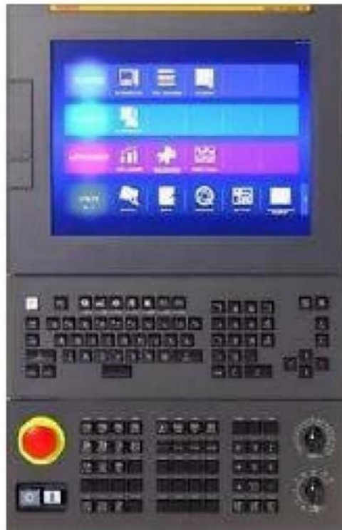
Nuovo CNC Fanuc 0i-TF PLUS con schermo LCD 15"

via Piratello 59/3 - 48022 Lugo (RA) - ITALY tel: +39 0545-31905 - fax: +39 0545-32055 C.F. e P.IVA 00955360391 - Cap. Soc. i.v. € 1.000.000 email: info@lughese.com / web site: www.lughese.com