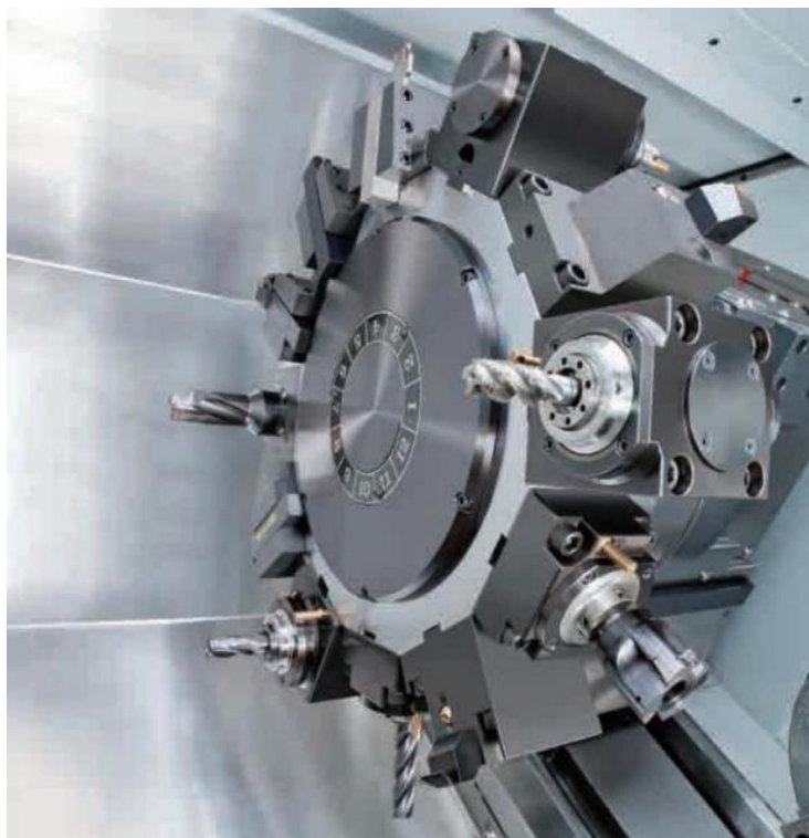
Torretta motorizzata a 12 posizioni