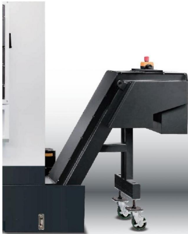
Evacuatore trucioli a tappeto

email: info@lughese.com / web site: www.lughese.com