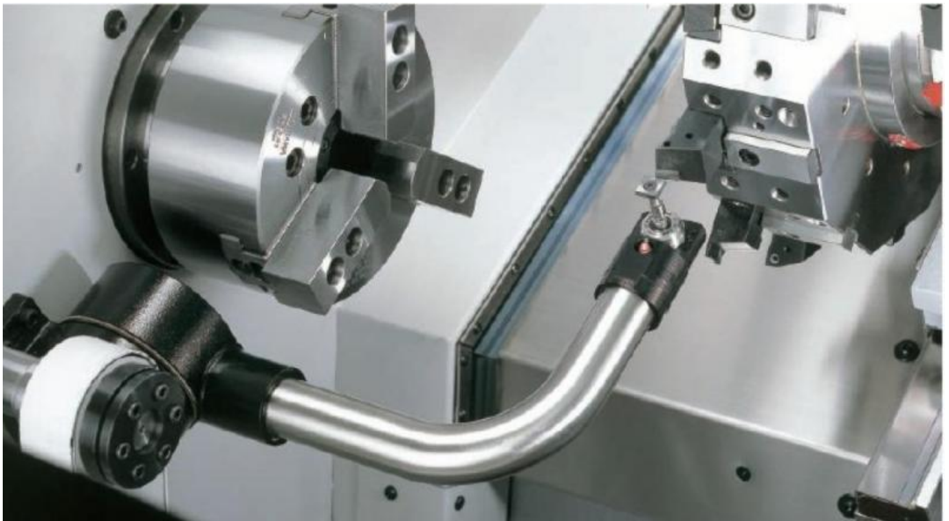
Presetting utensili HPMA